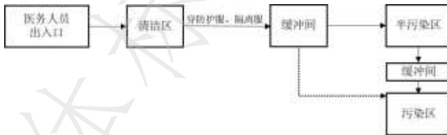
图 2 传染病应急医院医务人员由清洁区进入半污染区、污染区流程