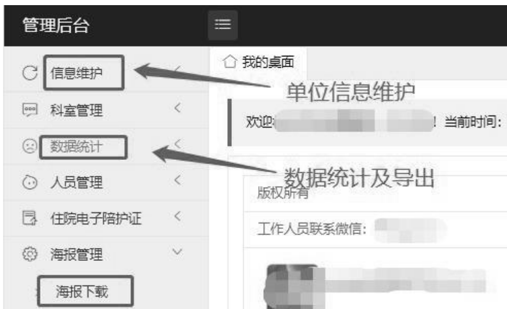
图 1 系统管理

3.患者可提前申报。扫以下二维码，进入“粤卫平台”微信公众号，点击弹出的链接或菜单底部【粤卫平台】-【健康申报卡】选择场所后填写相关信息进行申报。（见图3）