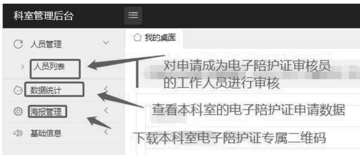
图4 科室管理员审核

3. 电子陪护证审核及查验。电子陪护证审核员对陪护人员提交的申请进行审核（见图6）；同时，定期查验电子陪护证有效性，可通过再次扫码或进入“我的陪护证”页面查看电子陪护证。