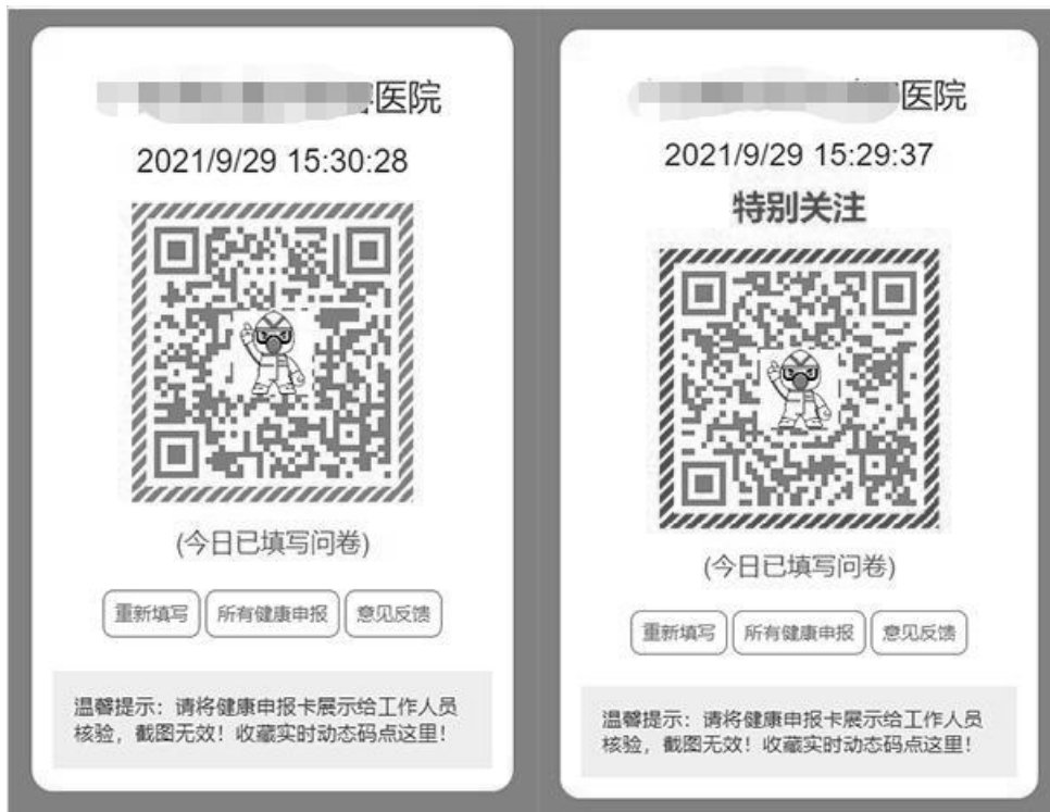
图 2 “健康申报卡”动态图