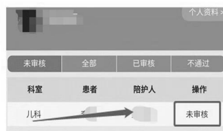
图 6“电子陪护证”审核员注册及审核流程